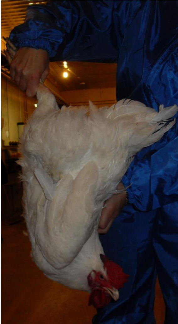
Kuva 4 Suuria lintuja on hyvä kantaa tarttumalla jalkoihin ja toisen siiven tyveen.