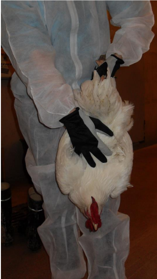
Kuva 2 Riippuminen reittä vasten rauhoittaa lintua ja vähentää siipien räpyttelyä.