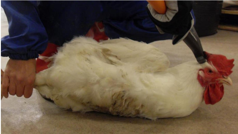
Kuva 9 Tainnutettaessa lintu iskulla päähän oikea tainnutuskohta on silmän ja korvan puolivälissä.