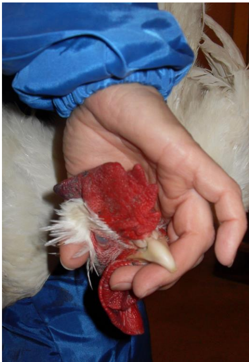
Kuva 8 Tarttumaote linnun päähän manuaalisen niskanmurron yhteydessä.