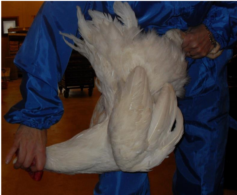
Kuva 7 Niskanmurto perustuu linnun niskan samanaikaiseen venytykseen ja kiertoon läheltä kallon liitosta. Manuaalinen niskanmurto on sallittu alle 3 kiloiselle siipikarjalle. Kuvan suurikokoista kukkoa on käytetty vain havainnollistamaan niskanmurron suorittamista.