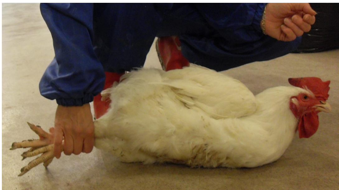
Kuva 1 Kiinniotettua lintua voi pitää paikoillaan lattiaa vasten.

Kanat ja broilerit otetaan kiinni tarttumalla molempiin sääriin mahdollisimman alhaalta. Nostaminen ja kantaminen molemmista jaloista vähentää linnuille aiheutuvaa kärsimystä ja vammoja. Kiinniotettu lintu kellistetään mahalleen (Kuva 1) ja nostetaan jaloista hellävaraisesti siten, että linnun rinta on kantajaa kohti pään riippuessa alaspäin. Mikäli lintu alkaa räpytellä siipiään kiinnioton tai lopetuspaikalle siirtämisen aikana, hyvä toimintatapa on antaa linnun rauhoittua riiputtamalla sitä muutamia sekunteja linnun rinta vasten käsittelijän reittä (Kuva 2). Siipien räpyttelyn väheneminen helpottaa linnun käsittelyä.