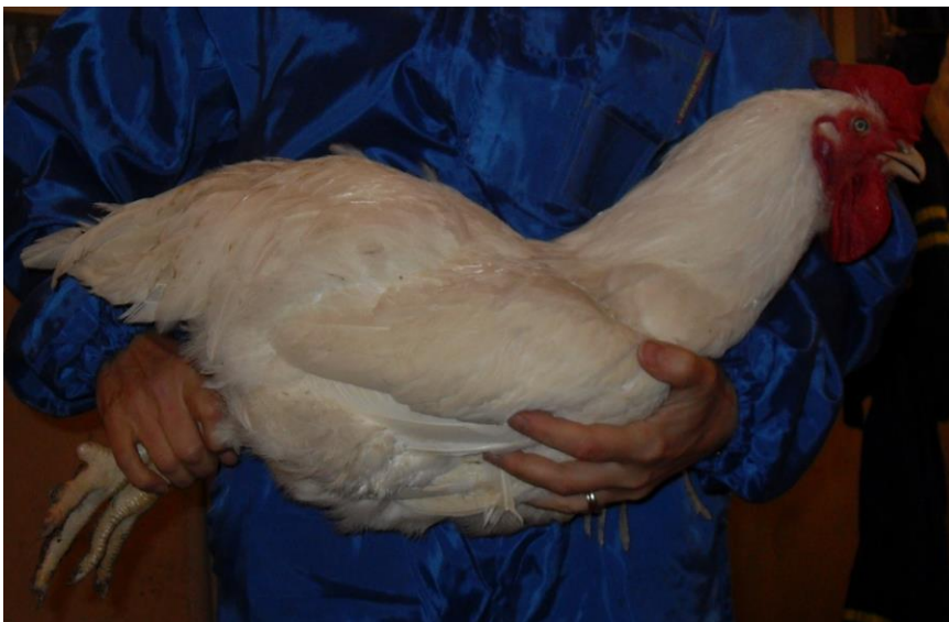
Kuva 3 Linnun nostaminen rinnan alta tukien.