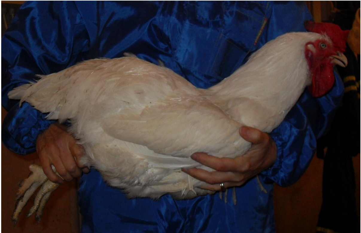
Kuva 1. Kanan nostaminen rinnan alta tukien.