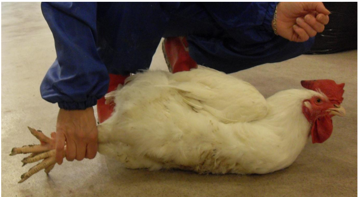
Kuva 2. Kiinniotettua lintua voi pitää paikoillaan lattiaa vasten.