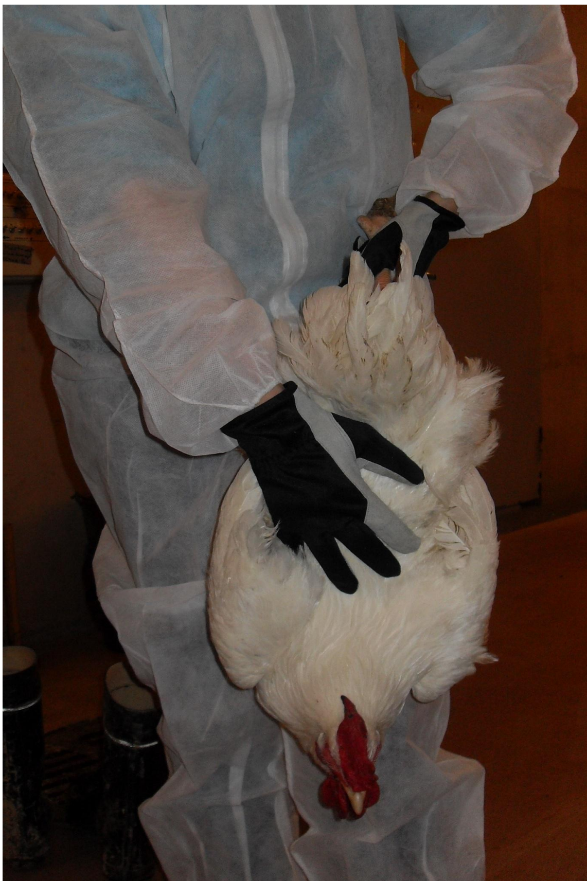
Kuva 3. Riippuminen reittä vasten rauhoittaa lintua ja vähentää siipien räpyttelyä.