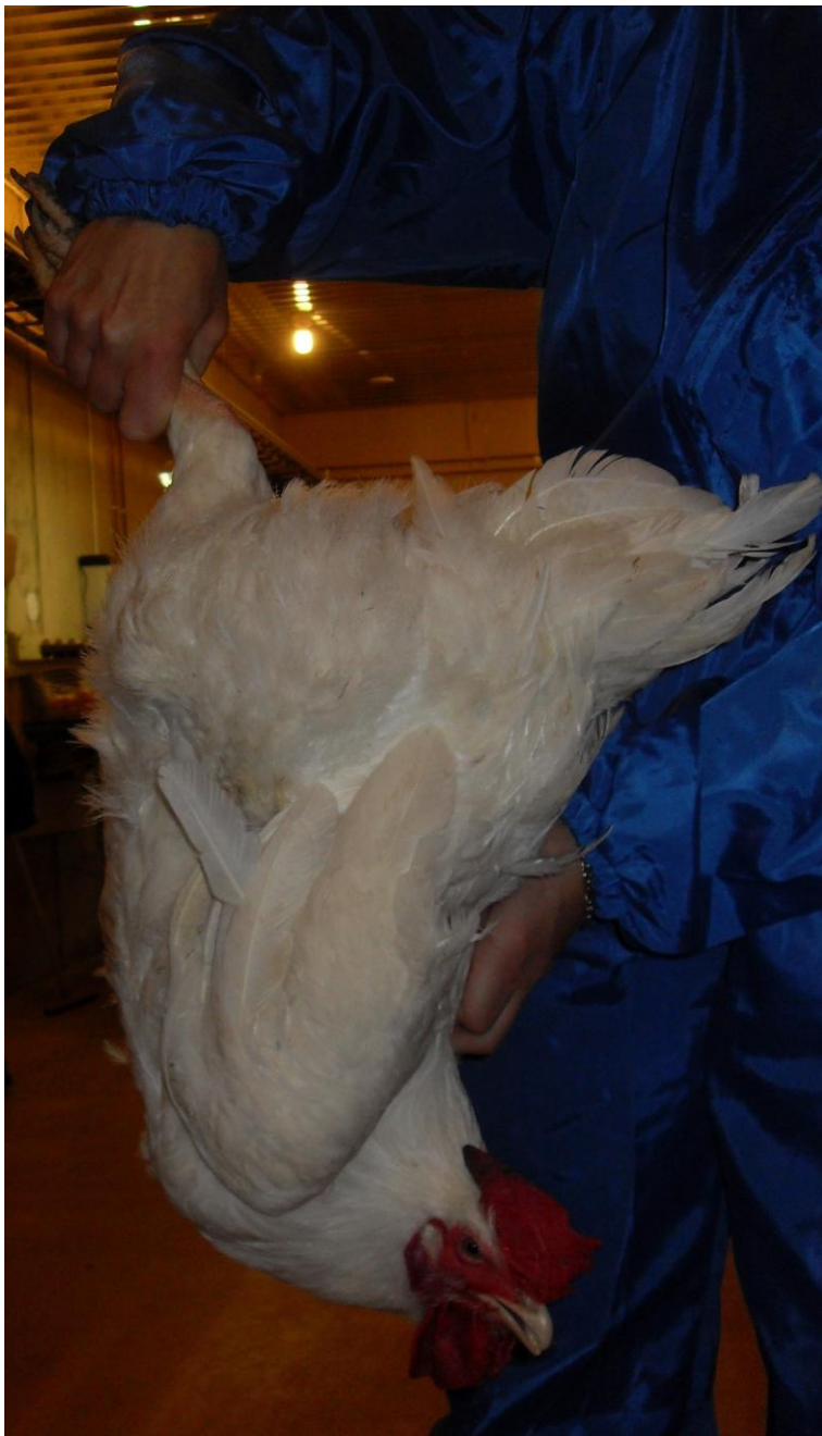
Kuva 4. Suuria lintuja on hyvä kantaa tarttumalla jalkoihin ja toisen siiven tyveen.

Kalkkuna. Kalkkunat on nostettava ja kannettava yksitellen eikä tämä saa tapahtua vain yhdestä jalasta kiinni pitäen ( Vna 677/2010 ). Kanna kalkkunoita aina molemmista jaloista tai jaloista ja siiven tyvestä. Nuoret, 7-14 viikon ikäiset, kalkkunat pyydystetään tarttumalla molempiin jalkoihin, jonka jälkeen lintu lasketaan lattialle rintansa päälle nostamalla toisella kädellä jaloista ja pitämällä toista kättä toisen siiven päällä räpyttämisen ehkäisemiseksi (kuva 3). Täysikasvuiset, 14-21 viikkoiset, kalkkunat ovat suuria ja voivat käsiteltäessä aiheuttaa vahinkoa sekä ihmiselle että itselleen. Niitä nostetaan tarttumalla itsestä kauempana olevan siiven tyveen läheltä linnun vartaloa sekä toisella kädellä jaloista (kuva 4). Nosta ja kanna kalkkunaa lähellä omaa vartaloasi. Aikuisia kalkkunoita voi pyydystää ja kantaa myös tarttumalla molempiin siipiin läheltä linnun vartaloa. Mikäli lintu on tarkoitus laittaa lopetusta varten laatikkoon tai konttiin, laita se sinne pää edellä varoen ettei lintu ruhjoudu kontin rakenteisiin tai täyttöluukkuun.