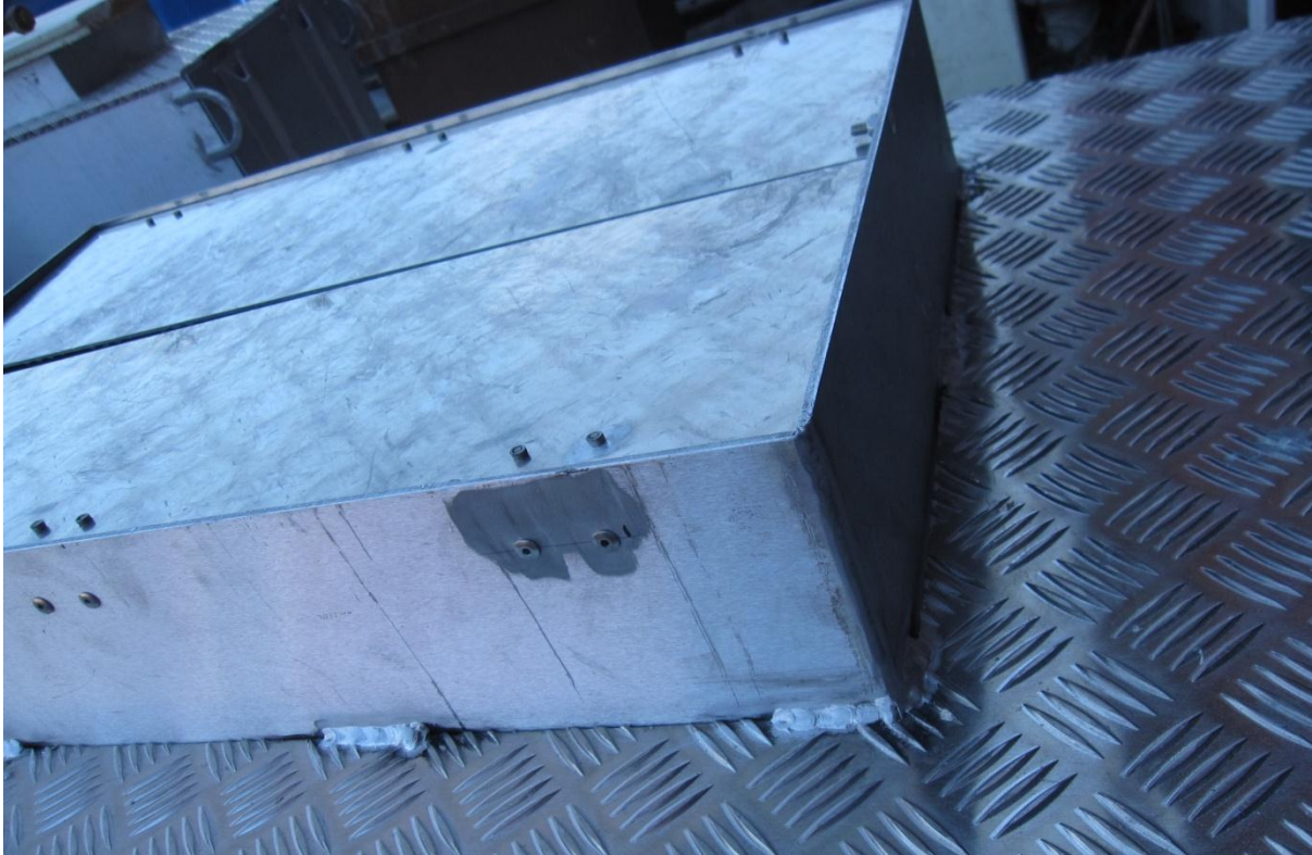
Kuva 6. Saranoitu, sisäänpäin aukeava lopetuskontin täyttöluukku.

toimintaolosuhteissa kaikkina vuodenaikoina. Eläimiä tulee varjella vältettävissä olevalta kivulta, tuskalta ja kärsimykseltä lopetuksen ja siihen liittyvien toimien aikana. Lopetukseen käytettävä tila ei saa sisältää teräviä kulmia tai sellaisia rakenteita, joihin eläin voisi loukata itsensä. Kammioiden on hyvä olla mahdollisimman tiiviitä, jotta vuotoina menetetään mahdollisimman vähän kaasua. Kammion täyttöluukku on hyvä varustaa saranoiduilla, sisäänpäin aukeavilla läpillä (kuva 6).