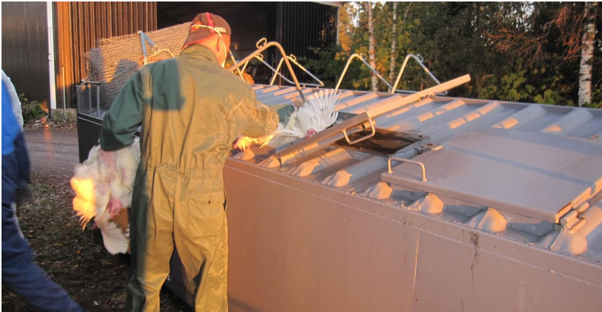
Kuva 7. Kanoja lopetetaan hiilidioksidilla esitäytetyssä, kanalan ulkopuolelle sijoitetussa suuressa kontissa.

CO 2 :n ärsyttävyyttä voidaan vähentää altistamalla linnut asteittain kasvavalle CO 2 -pitoisuudelle. Asteittainen altistus kasvavalle hiilidioksidipitoisuudelle soveltuu käytettäväksi ennalta tiivistetyissä rakennuksissa, kammioissa joihin eläimet siirretään lopetettaviksi kuljetuslaatikoissaan tai suurissa kammioissa (kuva 7), joihin eläimiä siirretään lopetettavaksi yksi eläinkerros kerrallaan. Lopetettaessa lintuja kammiossa täyttämällä sitä kerros kerrokselta, on varmistettava että edelliset linnut ovat kuolleet ennen seuraavien tuontia kammioon. Asteittainen altistus kasvavalle CO 2 -pitoisuudelle ei sen sijaan sovellu hitautensa vuoksi käytettäväksi jatkuvätäyttöisissä siirreltäväissä pienkontteissa. Pienkonteissa tulee käyttää altistusta suoraan korkealle CO 2 -pitoisuudelle (kontti esitäytetään CO 2 :lla vähintään 55 %:iin ja kaasupitoisuutta ylläpidetään tällä tasolla koko lopetustoiminnan ajan). Jälkikäteen tiivistettävissä kammioissa, joissa lopetus tapahtuu eläinten ollessa kuljetuslaatikoissa, voidaan lopetukseen käyttää myös inerttejä kaasuja.