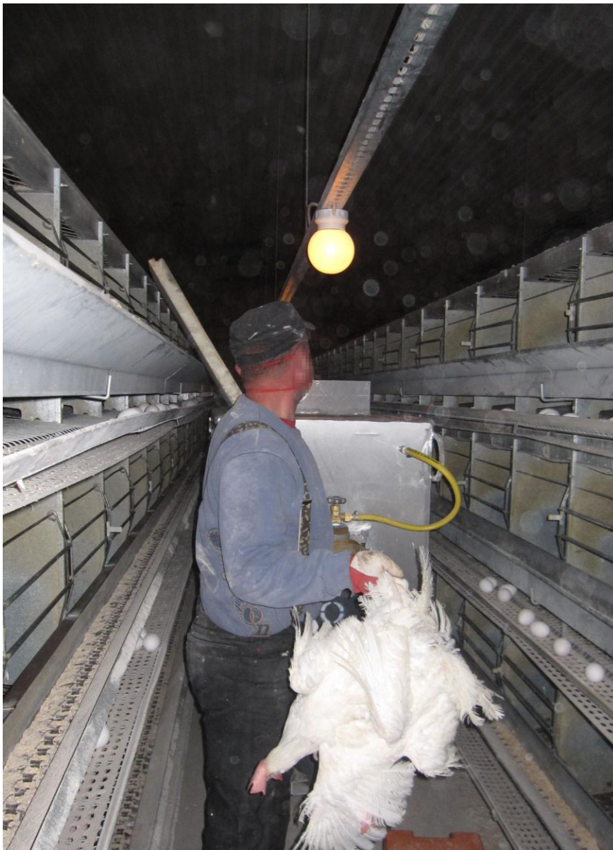
Kuva 8. Kanoja lopetetaan hiilidioksidilla esitäytetyssä siirreltävässä pienkontissa. Kuva vuodelta 2011, jolloin vanhan mallisia häkkikanaloita oli vielä käytössä.

Jatkuvatäyttöistä pienkammiota tai lopetuskonttia käytettäessä linnut kerätään eläinsuojasta käsin, ja lasketaan välittömästi hiilidioksidilla 70 %:n pitoisuuteen (MMMp 5/EEO/2000) esitäytettyyn lopetusvaunuun (kuva 8). Lopetusasetuksen soveltamisen alkaessa kontin CO 2 -pitoisuutta on mahdollista hieman laskea. Linnut menettävät tajuntansa 20–30 sekunnissa hengitysilman CO 2 pitoisuuden ollessa yli 45 % ja kuolevat 2-3 minuutin altistuksessa. Koska tajunnan menetys ja kuolema eivät kaasulopetuksessa ole välittömiä, on kontin täyttönopeuteen kiinnitettävä huomiota. Mikäli konttia täytetään liian nopeasti linnuilla, vielä tajuissaan olevat linnut hautautuvat toinen toistensa alle ja tukehtuvat. Muista varmistaa tainnutuksen onnistuminen (katso Onnistuneen kaasulopetuksen merkit ) sopivin väliajoin. Rauhallisempi työtahti edistää myös hyvää lintujen käsittelyä.